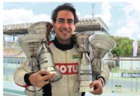
O primeiro lugar no pódio das quatro primeiras provas do Campeonato Paulista deste ano foi exclusivo do ex-kartista francês que decidiu fincar raízes no Brasil