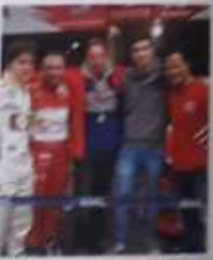
Em São Paulo com o piloto brasileiro