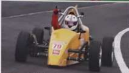
O primeiro teste no piloto foi em uma pista de provas da Companhia Paulista