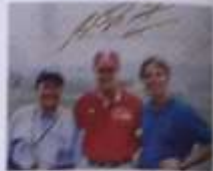
Com Dan Gurney e Michael Schumacher