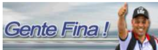
Imagem: F1, 28 de junho de 2023