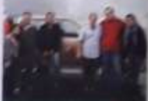
Com o campeão de Fórmula 1