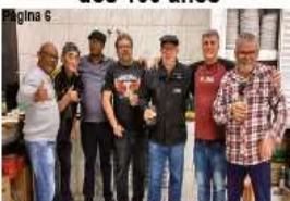
Copa diretivo do evento