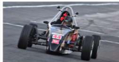
Itaquerenses têm apenas 23 anos e já começa a disputar nas provas

"Eu me adaptei muito bem ao carro, consegui um bom acerto e procurei sempre ser o mais rápido possível", disse o garoto de Itaquera. "Comecei a me dedicar ao automobilismo no ano passado e esse título certamente servirá como motivação para a sequência da minha carreira nas pistas", disse o itaquerense.