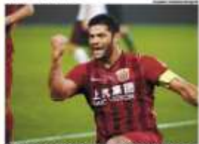
HULK | em foto de Flamengo e Atlético