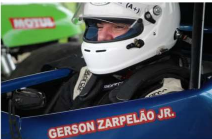
Zarpelão vai correr no sábado

Por renatochimirri - 20 de janeiro de 2021