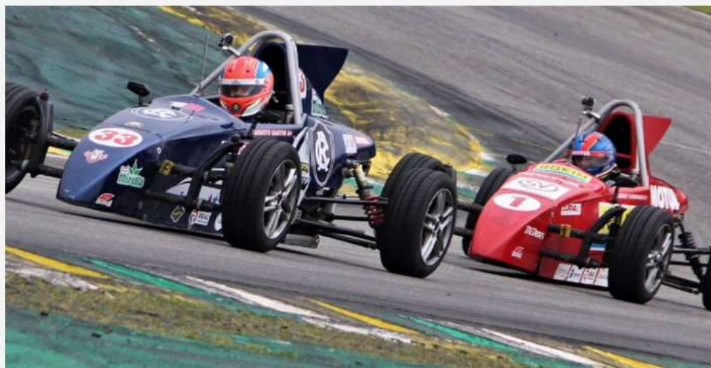
Santin superou dificuldades e conquista título para o automobilismo do Pará

O automobilismo paraense continua em alta e vem quebrando barreiras no fortalecimento do esporte no cenário nacional.