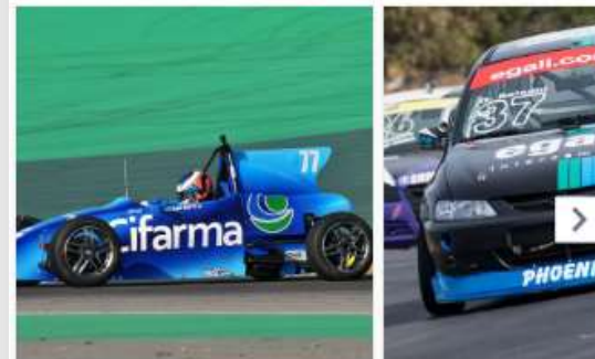
Copa ECPA define campeões em Piracicaba – Líder Esportes

Formula Vee Brasil Publicado por Fernando Santos [7] · 17 de outubro · O portal esportivo Líder destaca nesta quarta-feira a decisão de várias categorias da Copa ECPA, no próximo sábado, em Piracicaba, incluindo a Fórmula Vee. Confira como está a briga pelo título da segunda competição mais importante da FVee na temporada. O Líder também destaca o FVee Festival, no domingo, com oportunidades para drive day, curso de pilotagem e treinos livres. #fvee #formulavee #formulaveebrazil #piracicaba #lider #lideresportes #portallider #cpa #ecpabrazil #copaecpa