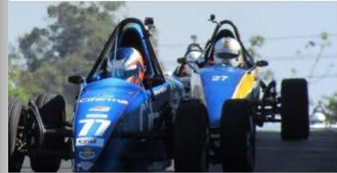
F1MANIA.LANCE.COM.BR Fórmula Vee: decisão da Copa ECPA e Festival para novos pilotos em Piracicaba - Outras Categorias - F1Mania

Formula Vee Brasil Publicado por Fernando Santos [7] · 15 de outubro · O portal F1 Mania, no Lance, destaca nesta segunda-feira o fim de semana especial da Fórmula Vee em Piracicaba, com a decisão da Copa ECPA e o 2º FVee Festival. Será no próximo sábado e domingo, com oportunidade para novos pilotos participarem de drive day e curso de pilotagem. Confira! #fvee #formulavee #formulaveebrazil #f1mania #lance #diariolance #lancenet #piracicaba #automobilismo #cpa #ecpabrazil #copaecpa #motorsport #formula