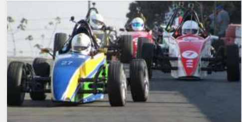
LIDERESPORTES.COM Fórmula Vee promove super fim de semana no ECPA – Líder Esportes

Formula Vee Brasil Publicado por Fernando Santos [7] · 21 de setembro Confira no portal Líder Esportes o fim de semana especial da Fórmula Vee em Piracicaba, com a 4ª etapa da Copa ECPA neste sábado e o FVee Festival no domingo, com drive day, curso de pilotagem e treinos livres. Ainda dá tempo para se inscrever. Faça sua reserva pelo site www.fvee.com.br #fvee #formulavee #formulaveebrazil #piracicaba #ecpa #ecpabrazil #copaecca #lideresportes #lider #automobilismo #driveday #cursodepilotagem