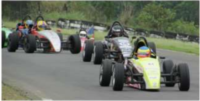
Carros da Fórmula Vee foram a grande atração dessa final de semana