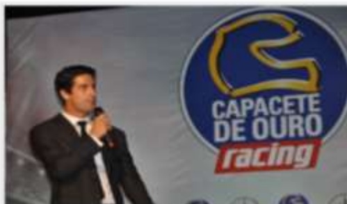
Lucas di Grassi, campeão da F-E, foi um dos homenageados.