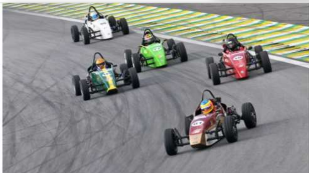
Fórmula Vee fará evento no final de semana do GP do Brasil de F1.

A Fórmula Vee realiza entre os dias 7 e 12 de novembro uma exposição de seus carros no Hotel Transamérica, em São Paulo (SP). O evento, que acontece na semana do Grande Prêmio do Brasil de Fórmula 1, marca os 50 anos da categoria que revelou Emerson Fittipaldi no Brasil.