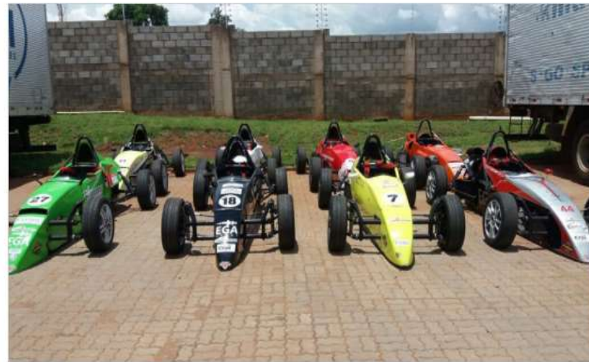
Carros estão na Capital para a segunda etapa da Copa do Mato Grosso do Sul