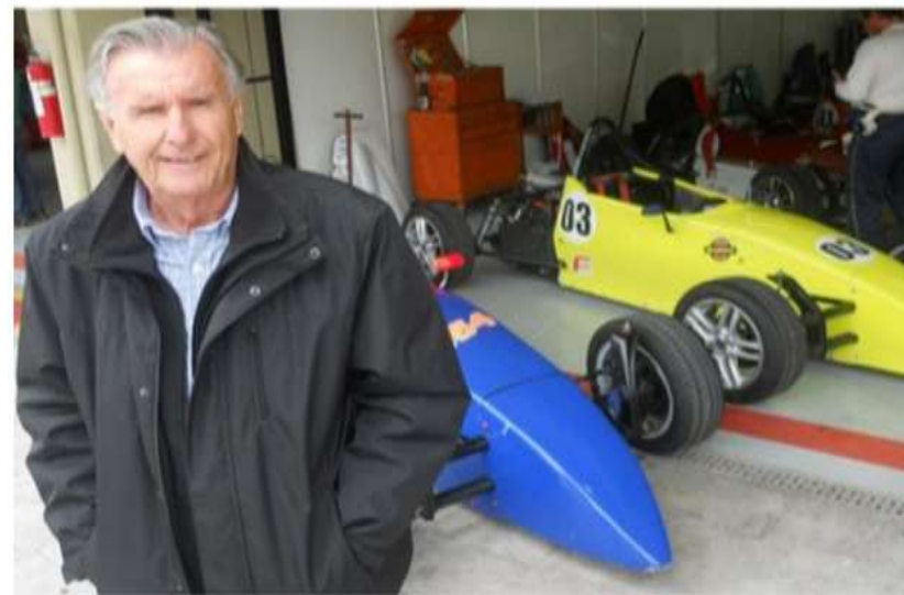
Ex-piloto Wilsinho Fittipaldi com um carro da Fórmula Vee

Wilsinho Fittipaldi lamentou a crise de pilotos que o Brasil passa na categoria e avisou que a Formula Vee é uma das boas opções para formação ESPORTE