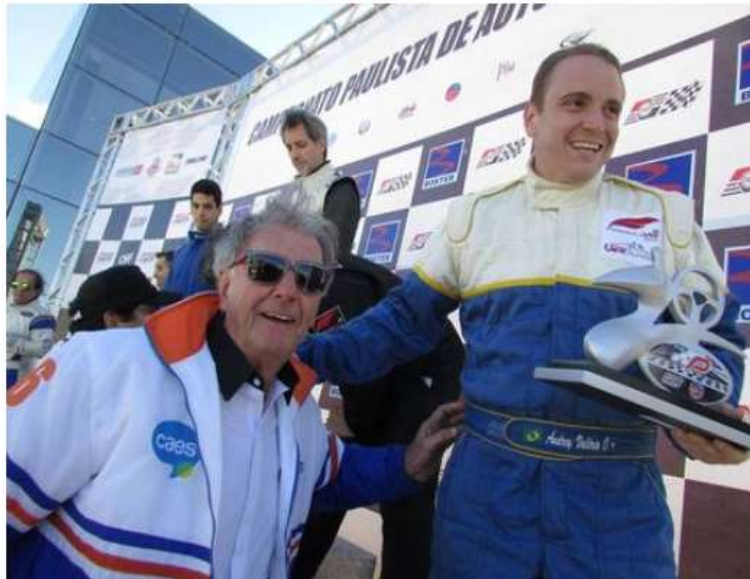
Ítalo-brasileiro da F-Vee cria 'vaquinha' para competir