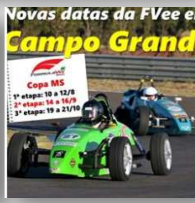
francisco.elisberto prefeitura detanquedarcia