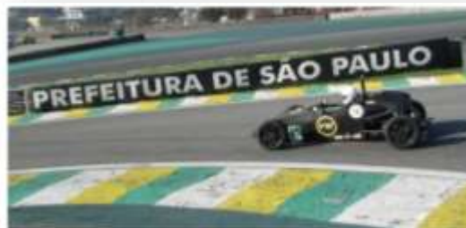
Primo e o alagoano campeão geral da Vee Júnior

– Esse é o sonho de todo jovem piloto que quer fazer carreira nas pistas: vencer em Interlagos, onde tantos grandes nomes triunfaram. Só tenho a agradecer o apoio que recebo do meu pai, que com muito sacrifício consegue bancar as despesas para que eu possa correr. E também agradecer a todos os alagoanos que torcem por mim – disse.