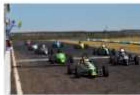
FVee abre a Copa MS em programação que terá ainda Stock Car, Copa Truck, Brasileiro de Velocidade na Terra e estadual de kart.

Por Bryson | Divulga em julho 24, 2018 às 9:53 pm. Categorias: