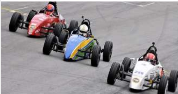
F1MANIALANCE.COM.BR Fórmula Vee abre segunda metade do "Paulistão" com disputa acirrada pelo título em Interlagos - Outras Categoria...

Formula Vee Brasil Publicado por Fernando Santos 17 · 12 de julho às 13:52 · 🌐 O portal F1 Mania, no Lance, mostra nesta quinta-feira as expectativas para a sexta etapa do Paulistão de FVee, que acontece neste sábado (14/7), em Interlagos. Confira a publicação, que relata a briga pelo título envolvendo até sete pilotos, nesta etapa que abre a segunda metade do campeonato. #fvee #formulavee #formulaveebrazil #interlagos #automobilismo #f1mania #lance #diariolance #lancenet