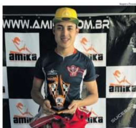
> Piloto tem como ídolo Ayrton Senna e sonha em chegar na Fórmula 1

Tendo o piloto Ayrton Senna como inspiração, o jovem itapeviense sonha em chegar à Fórmula 1, competição mais conhecida de automobilismo no mundo inteiro. "É triste olharmos e vemos que este ano não temos um brasileiro representando o nosso país, temos tanta tradição nesse esporte, já tivemos tantos campeões, como o Senna, Piquet e Fittipaldi. Não ter ninguém agora realmente me entristece", afirma.