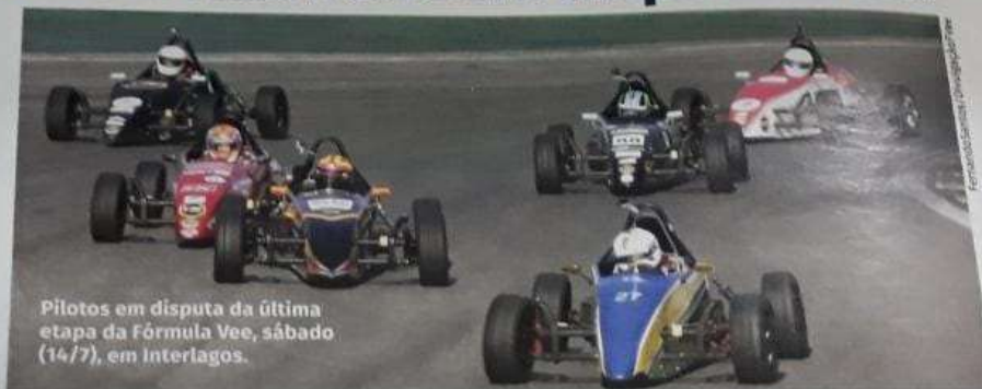
Pilotos em disputa da última etapa da Fórmula Vee, sábado (14/7), em Interlagos.

"É um local amplo, apropriado para uma prova da Fórmula Vee e que vai exigir poucos ajustes, como instalação de proteções de