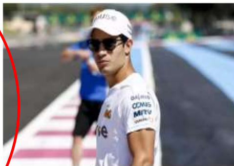
Sette Câmara inicia pré-temporada da F2 nesta terça-feira