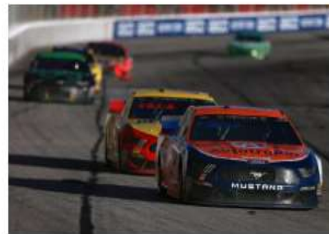
Nascar: Keselowski vence Truex Jr. e triunfa em Atlanta