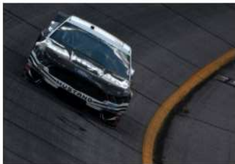
Aric Almirola fatura a pole da Nascar em Atlanta