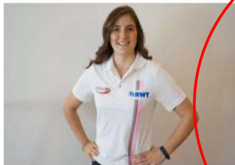
Tatiana Calderón defenderá a Arden na Fórmula 2