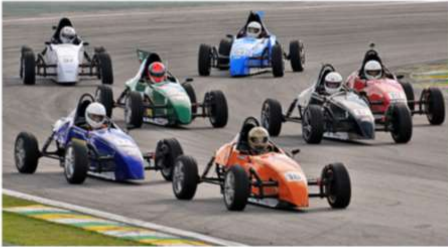
Quatro pilotos venceram na segunda etapa do Campeonato Paulista