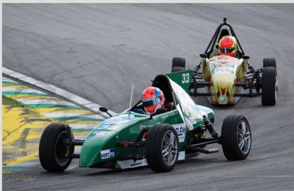
Santin dispara na liderança após uma vitória e um segundo lugar no fim de semana.

Carnaval será tranquilo para o piloto paraense Augusto Santin, que disparou na liderança da Fórmula Vee após vencer uma das duas provas disputadas no último fim de semana no circuito de Interlagos, em São Paulo (SP).