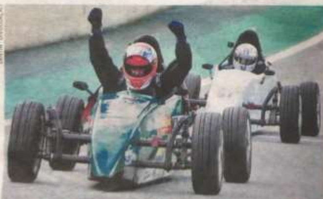
TABELA DO CAMPEONATO