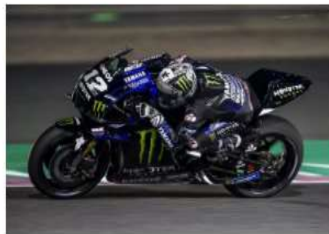
Viñales domina último dia de testes da MotoGP no Catar