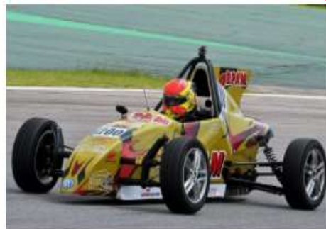
F-Vee: jovem de 14 anos terá Wilsinho Fittipaldi como coach