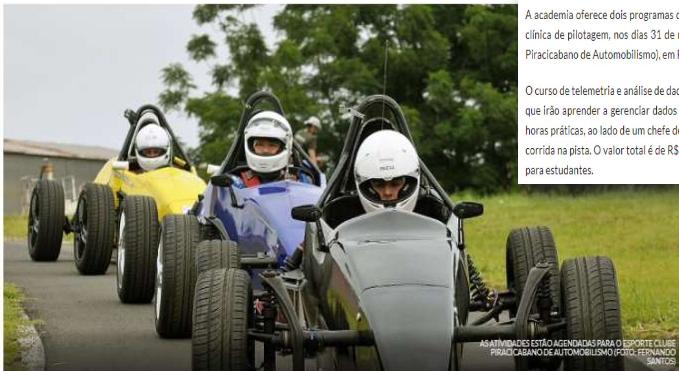
AS ATIVIDADES ESTÃO AGENDADAS PARA O ESPORTE CLUBE PIRACICABANO DE AUTOMOBILISMO

Publicado no dia 13 de fevereiro de 2019