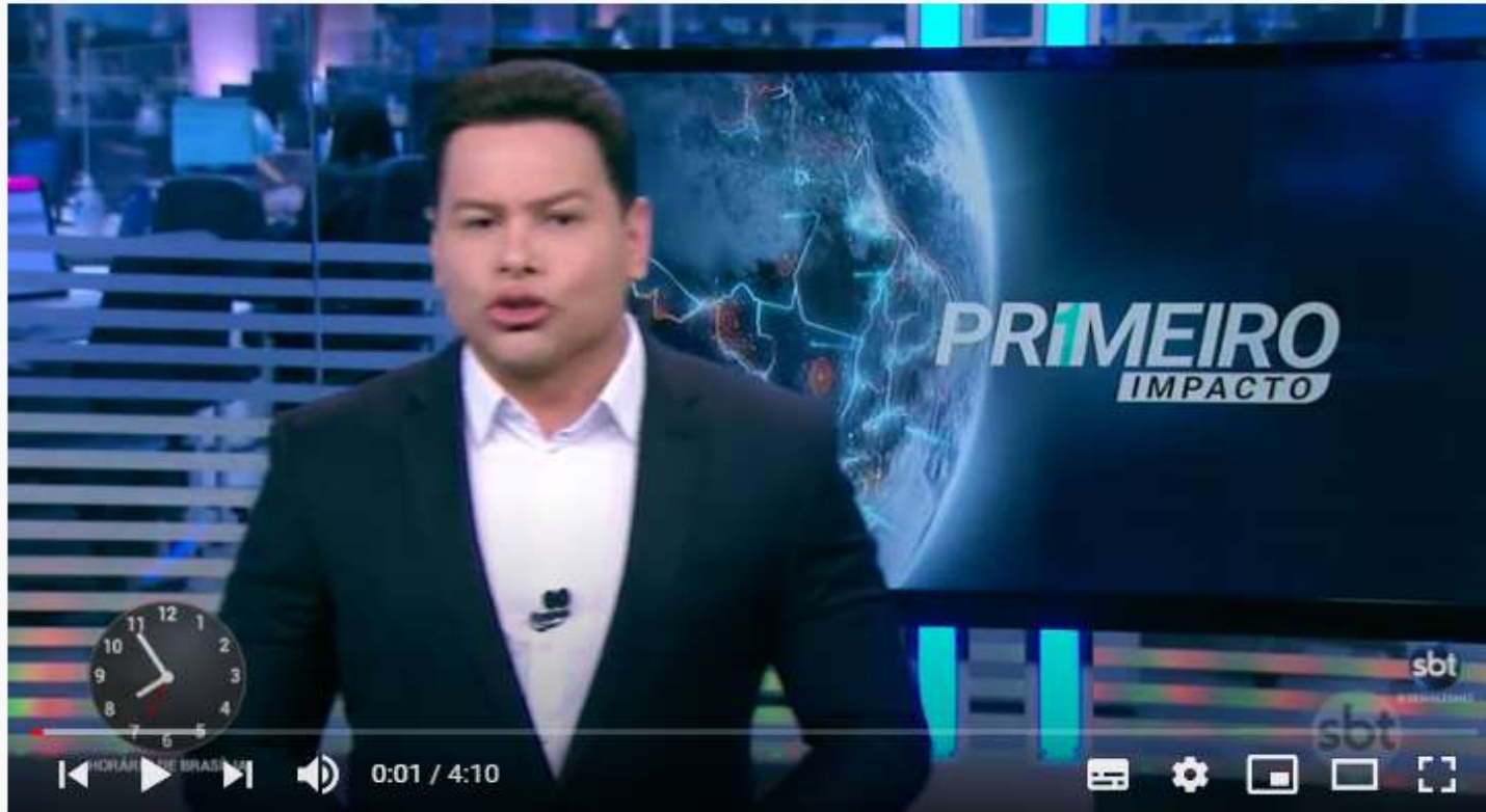
Piloto da periferia de SP sonha em disputar Fórmula 1 | Primeiro Impacto (08/12/20)