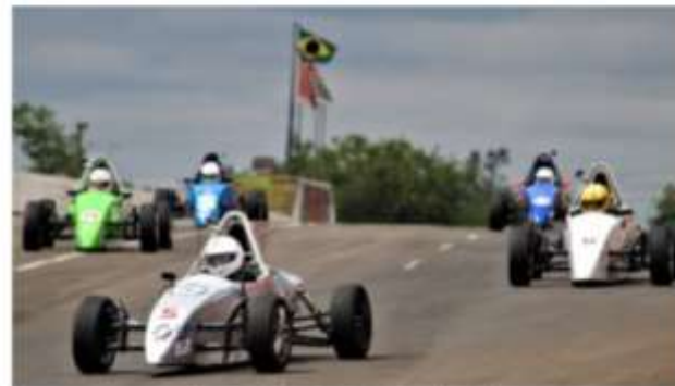
Corrida Fórmula Vee

Para saber mais sobre a ECPA, acesse www.ecpa.com.br .