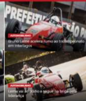
Leme vai ao pódio e segue na briga por liderança