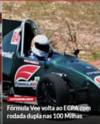
Fórmula Vee volta ao ECPA com rodada dupla nas 100 Milhas