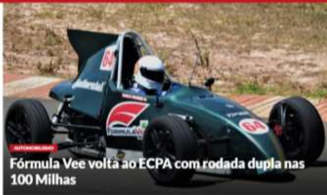
Fórmula Vee volta ao ECPA com rodada dupla nas 100 Milhas