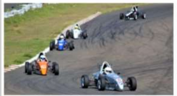
Disputa da Copa ECPA F/Promo Racing

«Eu terminei o Paulista numa boa posição e agora estou bastante otimista para conseguir um resultado ainda melhor. Certamente, será uma das competições mais difíceis que já participei. E sempre muito desgastante competir em Piracicaba, numa pista com um traçado que exige muito esforço físico. Normalmente são duas provas. Desta vez, serão quatro. Por isso, a dificuldade será um dobrar-esforço e físico.»