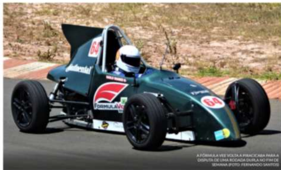
A FÓRMULA VEE VOLTA A PIRACICABA PARA A DISPUTA DE UMA RODADA DUPLA NO FIM DE SEMANA

Com rodada dupla, a Fórmula Vee participa neste fim de semana das 100 Milhas Piracicaba, prova de automobilismo mais tradicional no interior paulista, que completa 31 edições em 2020. A programação inclui duas etapas da Copa ECPA/FPromo Racing, com quatro provas no total. "É uma grande satisfação participar do evento, que é sem dúvida uma das maiores provas do automobilismo nacional", elogiou Wilson Fittipaldi Júnior, consultor técnico e instrutor da categoria. "Já disputei algumas vezes a corrida, desde a época em que era em pista de terra. Será uma enorme alegria estar de volta", completou.