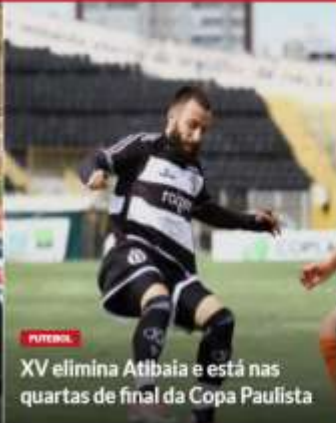
XV elimina Atibaia e está nas quartas de final da Copa Paulista