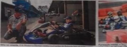
Oito no volante. Era Nelson Piquet, campeão brasileiro de kart em 1978.