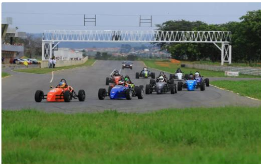
Provas acontecem no domingo, no autódromo de Curvelo