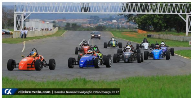
Pilotos disputam a primeira prova da Fórmula Vee em Curvelo, realizada em março, no GP Cristiano da Matta

Redação Click Curvelo | quinta-feira, agosto 03, 2017