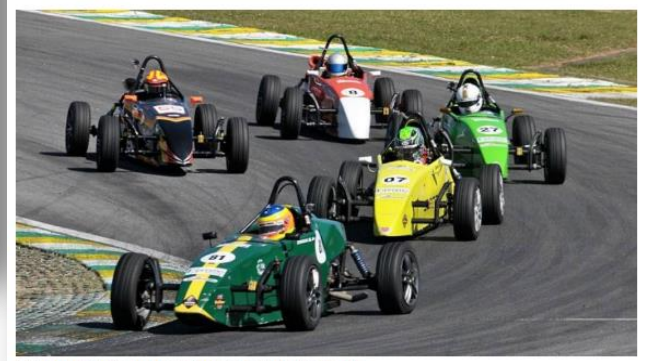
Corrida na Fórmula Vee.

O Estado fez o teste semanas atrás dentro de um Fórmula Vee no autódromo paulistano. A categoria, fundada na década de 1960 pelos irmãos Fittipaldi, cobra R$ 500 do 'calouro' que quer pilotar os mesmos bólidos usados nas competições.