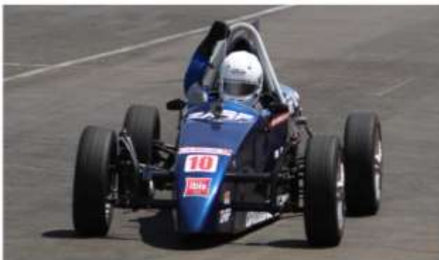
Lutando pelo título